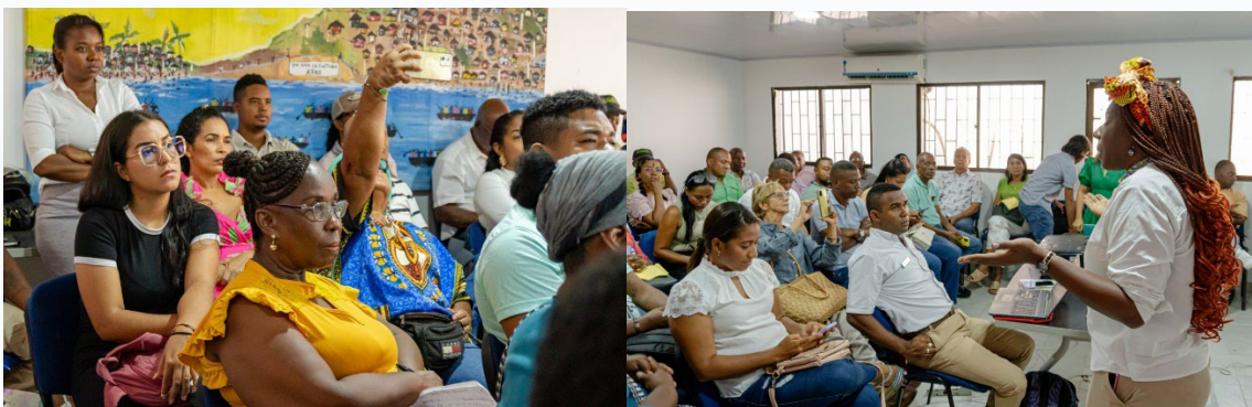
Tabla 2. Ejercicio participativo comunidades con enfoque diferencial