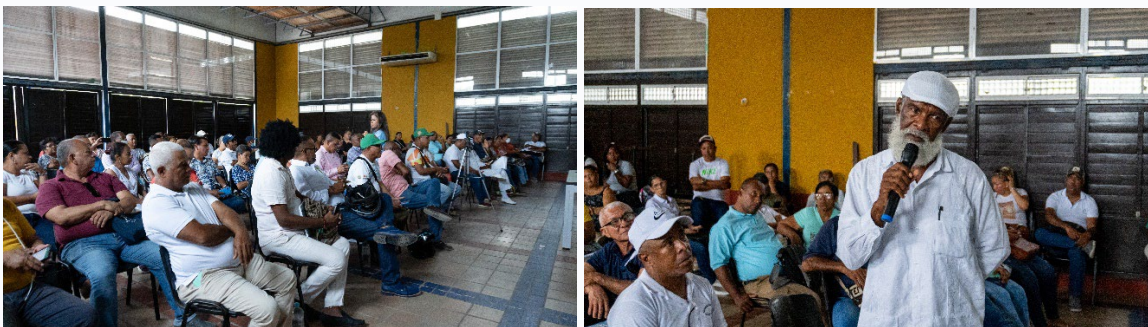
Ilustración 1. Ejercicio participativo